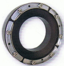
1 KRASO® Typ ED KRASO® Typ DD

V4A gegen Mehrpreis lieferbar ! Sämtliche Größen und Durchmesser auf Anfrage !