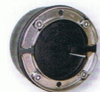
KRASO® Uni 100 DD/T