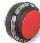
KRASO® Uni 150 DD