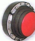
KRASO® Uni 200 DD