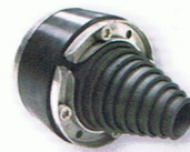
KRASO® Uni 100 DD