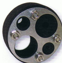
3 KRASO® Typ 150 M Ausführung: 1 Beispiel: 1 x 48 mm 1 x 6 mm 1 x 12 mm 1 x 18 mm