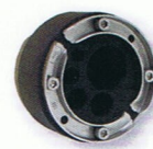
KRASO® Uni 100 DD/M