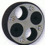
2 KRASO® Typ 100 M Ausführung: 2 Beispiel: 2 x 25 mm 1 x 8 mm 1 x 10 mm